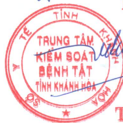
Tôn Thất Toàn