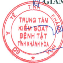
Tôn Thất Toàn